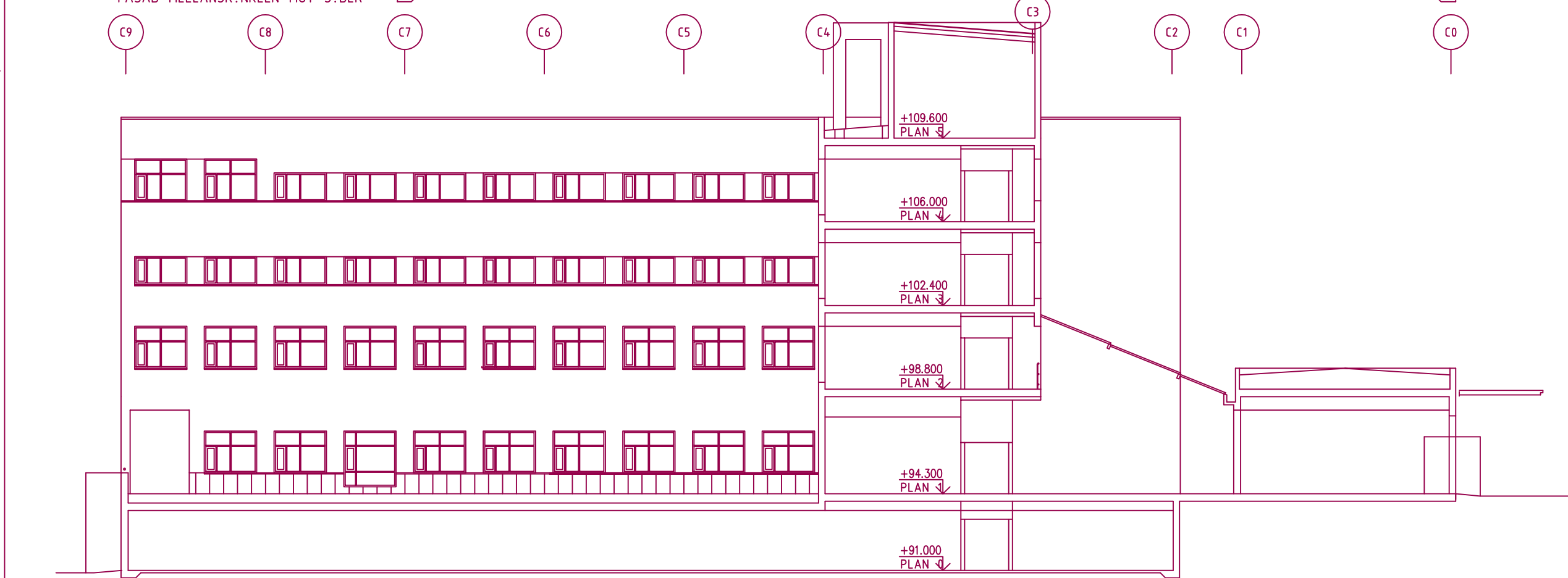
INGENJ?RSH?GSKOLAN FASAD MELLANSK?NKELN MOT NORR