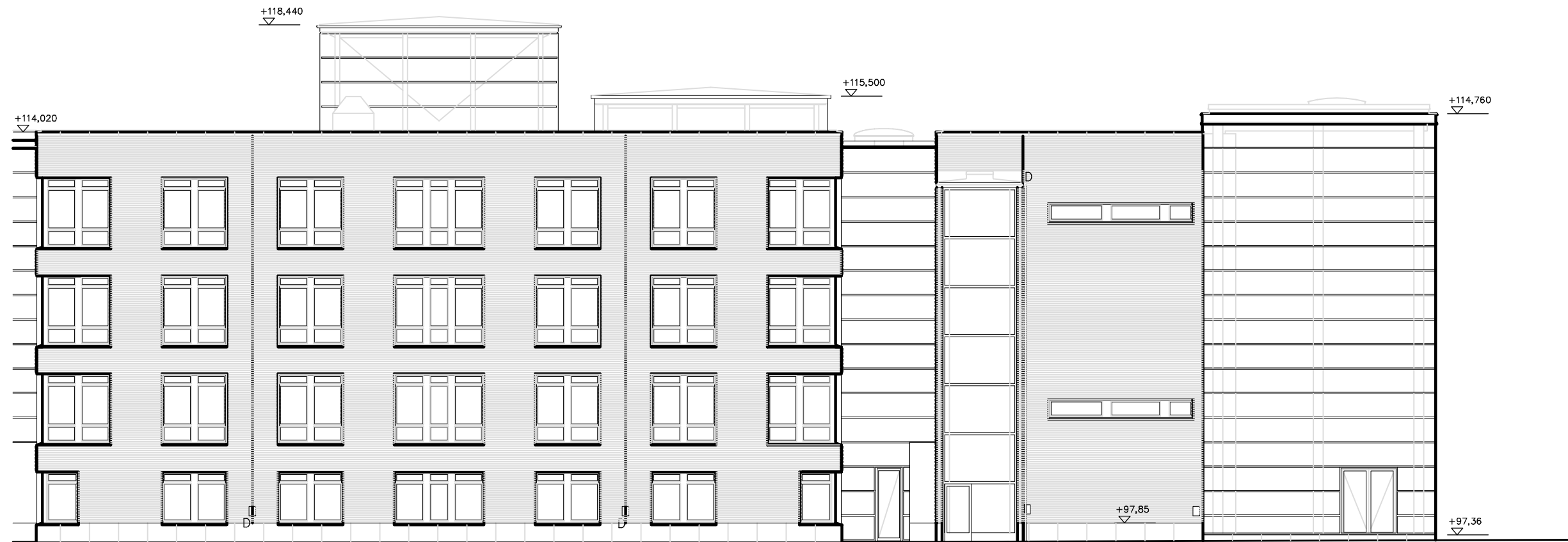
FASAD MOT VÄSTER HUS A, B OCH C