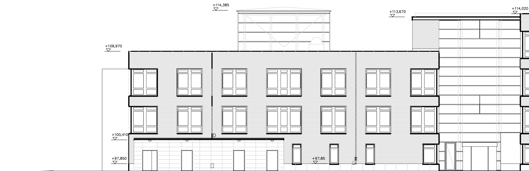
FASAD MOT VÄSTER HUS A, B OCH C