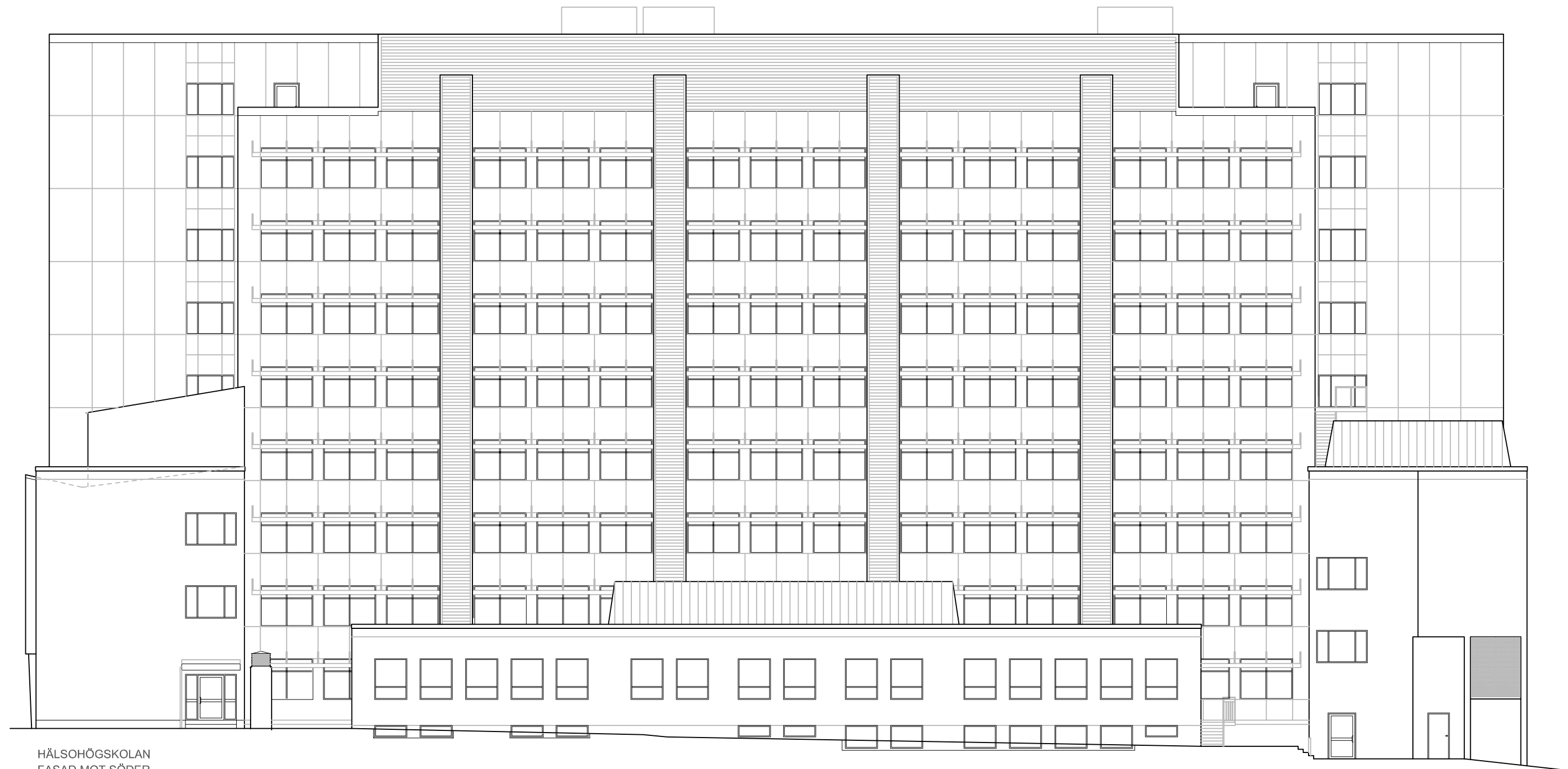
HÄLSOHÖGSKOLAN FASAD MOT SÖDER