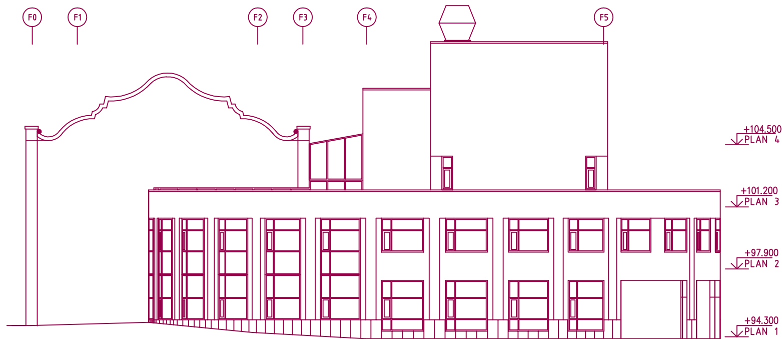
BIBLIOTEK FASAD MOT SÖDER